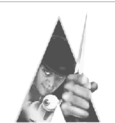
¡Éste no es el asesino de pedralbes! ¿Cual es entonces?