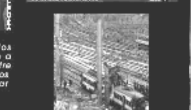
Job Bush 18/03/2003

"Puede asegurar a todas las que tienen sus dudas que a largo plazo esa relación entre España y EEUU dará beneficios que no se pueden imaginar ahora."